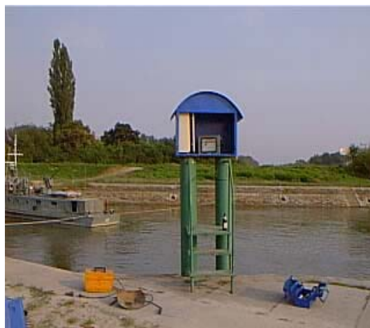
Сл.2. Метални заклон за опрему, р.Дунав, ХС Бездан