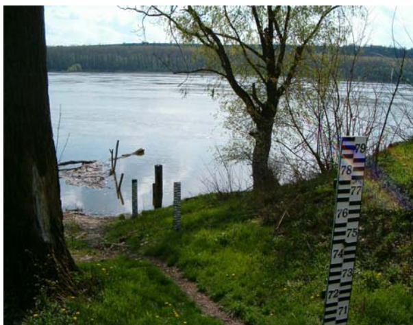
Сл. 1. Водомерна летва, р. Дунав, ХС Богојево