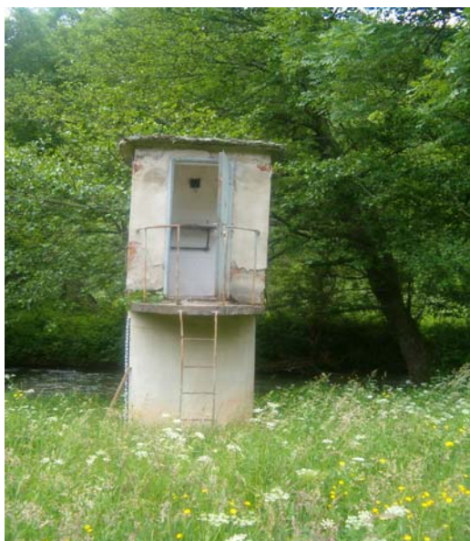
Сл. 3. Зидани заклон, р. Луковска, ХС Мерћез